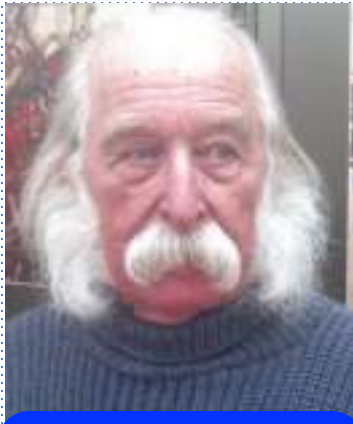
Живописець Іван Марчук