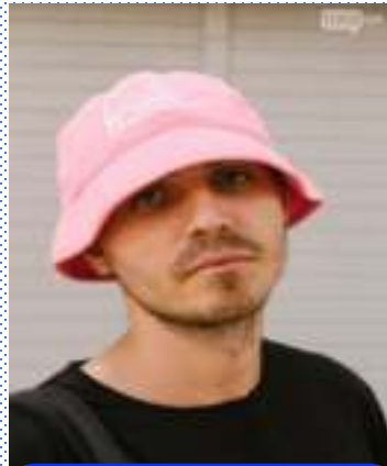
Музикант Олег Псюк