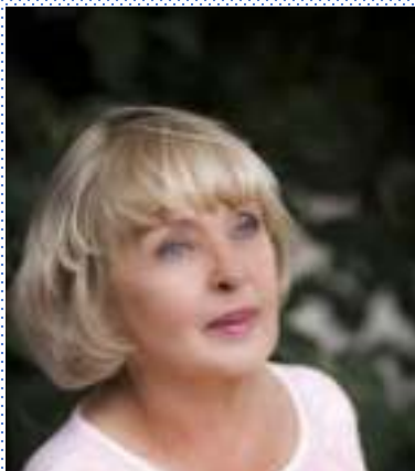
Актриса Ада Роговцева