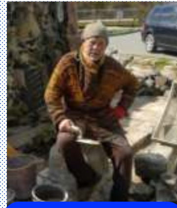
Скульптор Микола Головань